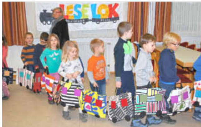
KIBÜ Lese-Lok am 14.03.19

Alle KITA-Kinder und die es noch werden wollen, sowie Geschwister, Eltern, Großeltern... sind herzlich eingeladen!