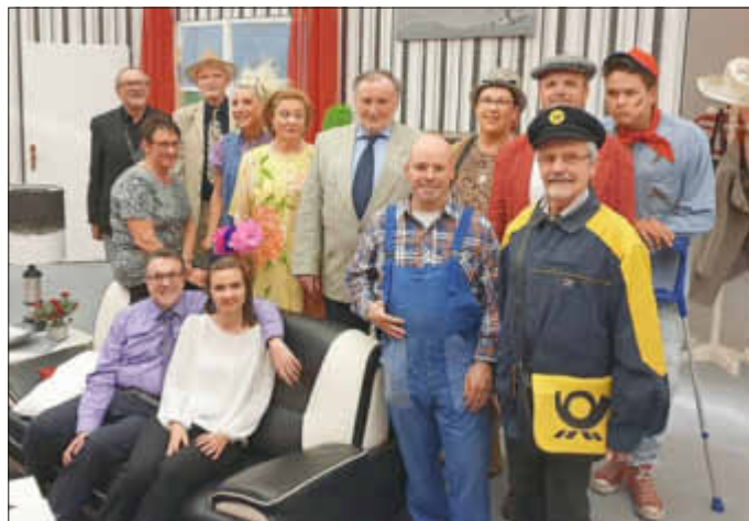
Theatergruppe des Heimat- und Kulturverein Queidersbach

wieder ist eine Spielsaison vorbei, die Bühne ist abgebaut. Seit November haben wir wöchentlich fleißig geprobt. Wir freuen uns sehr, dass Ihnen unser Stück „Reine Nervensache“ gefallen hat und bedanken und bei den zahlreichen Zuschauern für den Applaus! Wir wünschen Ihnen eine gute Zeit und freuen uns auf Ihren Besuch im nächsten Jahr!