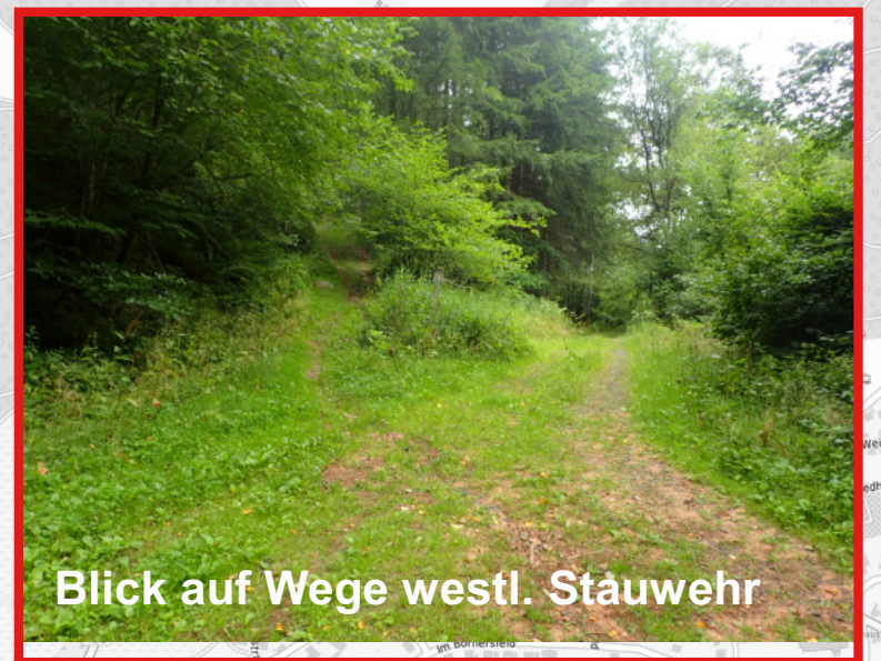
Blick auf Wege westl. Stauwehr