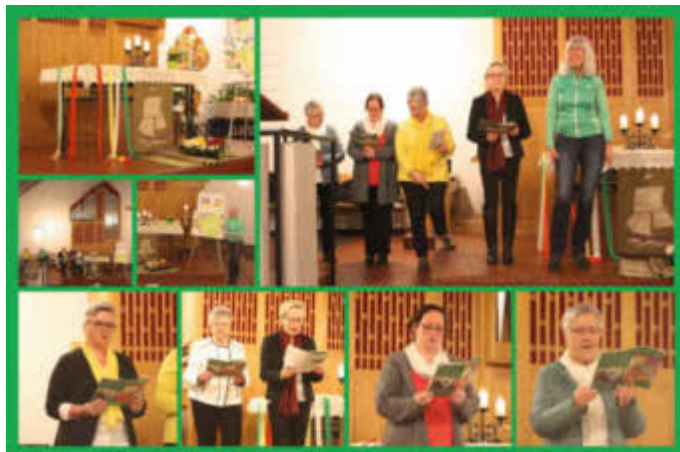
Weltgebetstag der Frauen - 6. März 2020 - Prot. Kirche Schopp