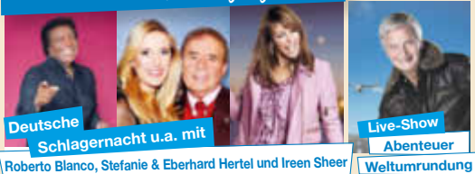
Deutsche Schlagnacht u.a. mit Roberto Blanco, Stefanie & Eberhard Hertel und Ireen Sheer