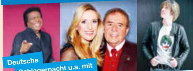
Deutsche Schlagnacht u.a. mit