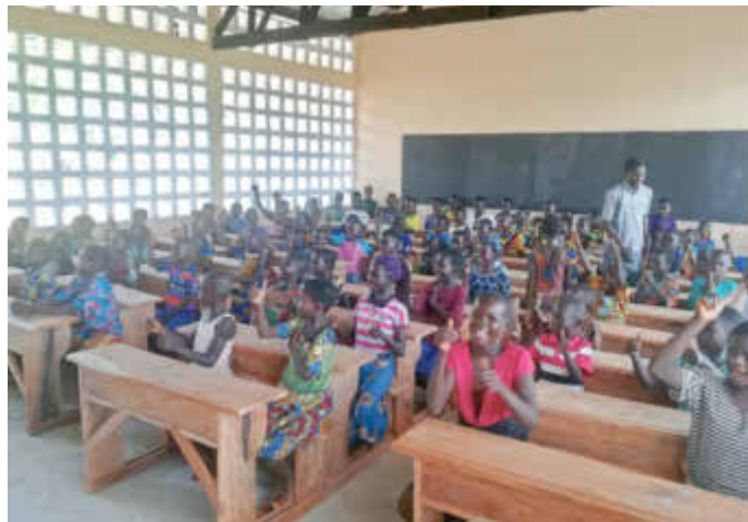
Schule und Klassenzimmer nach Fertigstellung Oktober 2021