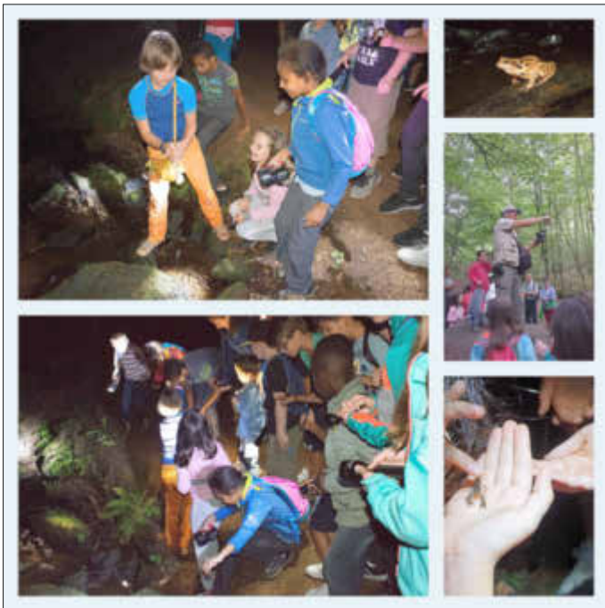
Impressionen aus dem Karlstal

Eine tolle Aktion ging mit diesem Erlebnis für dieses Jahr zu Ende.