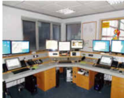
Bild: Feuerwehr-Einsatzzentrale heute

Feuerwehr-Einsatzzentrale angepasst werden. Nach der Modernisierung 1994 stand der Wehr ein Funktisch mit zwei Arbeitsplätzen zur Verfügung.