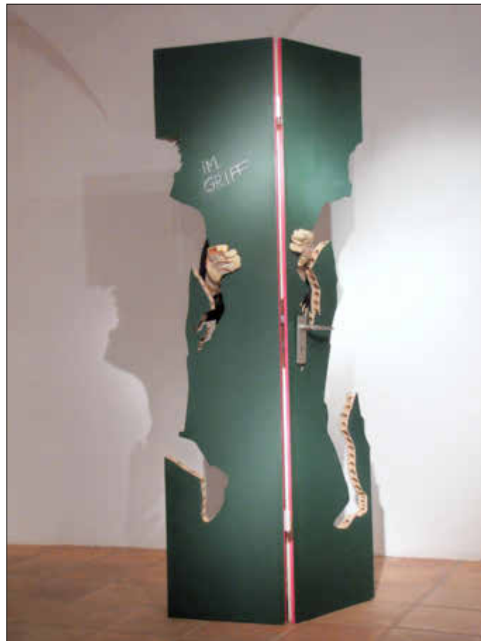
horizont im griff aussen

Die letzte Ausstellung am Unterhammer für dieses Jahr wird am 2. Oktober um 19 Uhr eröffnet und zeigt „Zwei Seiten einer Sache“.