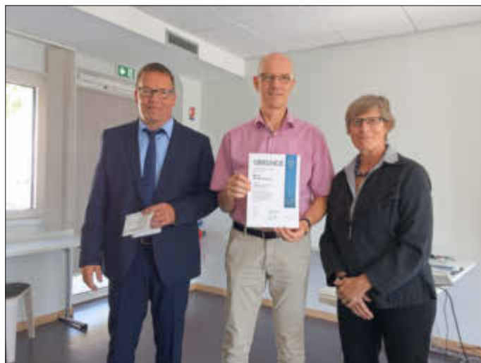
(Text & Foto: Bezirksverband Rheinhessen-Pfalz / Volksbund Deutsche Kriegsgräberfürsorge e.V.)

Herzlichen Dank an die Schülerinnen und Schüler dieser Schule, deren Eltern sowie an unsere Kontaktperson!