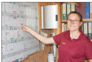
FÖJ-er:innen helfen bei Veranstaltungsplanung mit

Junge Menschen zwischen 18 und 26 Jahren können sich jetzt wieder für ein Orientierungs- und Bildungsjahr im Herzen des Biosphärenreservat Pfälzerwald bewerben. Das Freiwillige Ökologische Jahr Rheinland-Pfalz (FÖJ) versteht sich als eine Lebensphase, in der man die eigenen Fähigkeiten jenseits der schulischen Anforderungen kennen lernen kann. Es kann außerdem der Orientierung im Bereich der „grünen Berufe“ und einem konkreten Engagement für einen ganz praktischen Umweltschutz dienen. Im Haus der Nachhaltigkeit haben die FÖJ-ler die spannende und verantwortungsvolle Aufgabe, sich an der Empfangstheke des Infozentrums um die Betreuung der Besucher:innen und um den Pfälzer Waldladen zu kümmern.