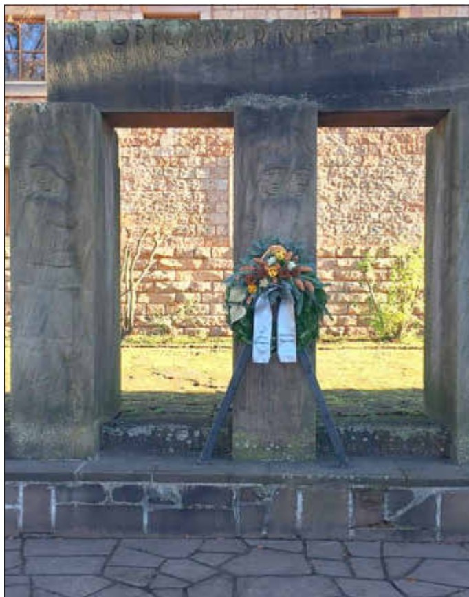
Das Foto zeigt das geschmückte Kriegerdenkmal

der Volkstrauertag im November dient dem Gedenken aller Kriegstoten und Opfer von Gwalt herrschaft sowie der Mahnung zu Versöhnung, Verständigung und Frieden. Wir begehen den Volkstrauertag aus Respekt vor den Millionen Opfern von Krieg und Gewalt, damit das Geschehene nicht verblasst und verdrängt wird. Die Weltkriege des 20. Jahrhunderts haben Millionen von Toten, Verwundeten und Vermissten gefordert, wobei die Vorstellungskraft des Einzelnen angesichts dieser immensen Zahlen versagen muss. Seit dem verheerenden Zweiten Weltkrieg sind über 75 Jahre vergangen, trotzdem hat sich der Frieden in Europa nicht dauerhaft erhalten. Denken wir nur an den Balkankrieg oder den aktuellen Überfall der Russen auf die Ukraine. Seit nunmehr einem dreiviertel Jahr sind wir Zeugen eines verbrecherischen Angriffskrieges, der uns täglich das Leid eines Volkes vor Augen führt, das sich mutig und unerschrocken einem unerbittlichen Aggressor widersetzt. Im Gedenken an die Kriegsoffer und deren Schicksal verneigen wir uns vor ihnen, und deshalb legt die Gemeinde an zwei zentralen Plätzen Kränze nieder.