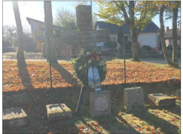
Das Foto zeigt das Ehrengrab am hiesigen Friedhof.

der Volkstrauertag im November dient dem Gedenken aller Kriegstoten und Opfer von Gwalt herrschaft sowie der Mahnung zu Versöhnung, Verständigung und Frieden. Wir begehen den Volkstrauertag aus Respekt vor den Millionen Opfern von Krieg und Gewalt, damit das Geschehene nicht verblasst und verdrängt wird. Die Weltkriege des 20. Jahrhunderts haben Millionen von Toten, Verwundeten und Vermissten gefordert, wobei die Vorstellungskraft des Einzelnen angesichts dieser immensen Zahlen versagen muss. Seit dem verheerenden Zweiten Weltkrieg sind über 75 Jahre vergangen, trotzdem hat sich der Frieden in Europa nicht dauerhaft erhalten. Denken wir nur an den Balkankrieg oder den aktuellen Überfall der Russen auf die Ukraine. Seit nunmehr einem dreiviertel Jahr sind wir Zeugen eines verbrecherischen Angriffskrieges, der uns täglich das Leid eines Volkes vor Augen führt, das sich mutig und unerschrocken einem unerbittlichen Aggressor widersetzt. Im Gedenken an die Kriegsoffer und deren Schicksal verneigen wir uns vor ihnen, und deshalb legt die Gemeinde an zwei zentralen Plätzen Kränze nieder.