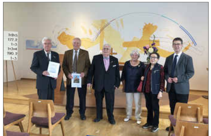
Jubelkonfirmation 26.5.24 - Protestantische Kirche Krickenbach - Jubilare zum 65. und 70. Konfirmationsjubiläum

Unsere Kirchengemeinde im Internet unter: www.dekanat-alsen-zundlauer.de und auf YouTube unter „Schopp-Linden-Krickenbach“.