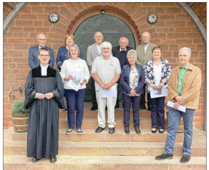
Jubelkonfirmation 26.5.24 - Protestantische Kirche Schopp - Jubilare zum 50., 60., 70. und 83. Konfirmationsjubiläum