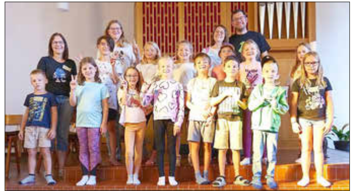
Teilnehmende der Lesenacht in der Protestantischen Kirche Schopp - 19./20. August 2024

Zum Schluss gab es für alle Teilnehmenden eine Urkunde und kleine Geschenke. Fazit: Es war eine tolle zweite Lesenacht mit vielen positiven Erinnerungen.