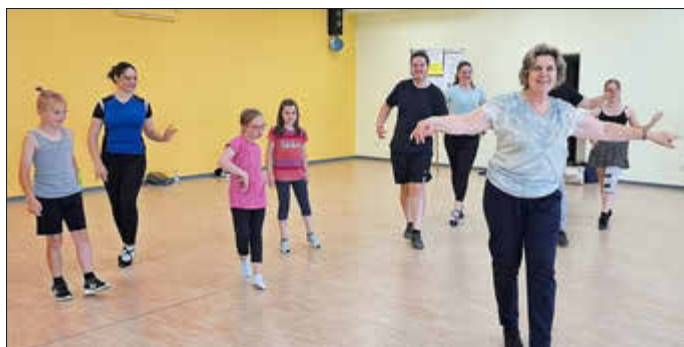
Tanz und Spiel