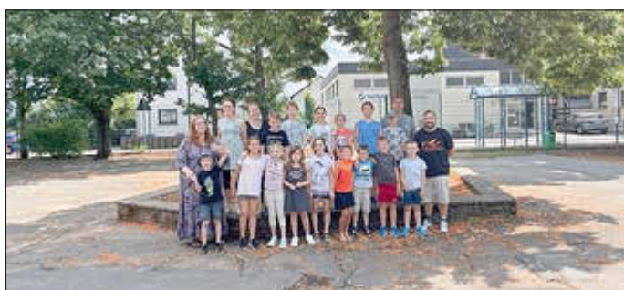
Ausflug in den Zoo Saarbrücken