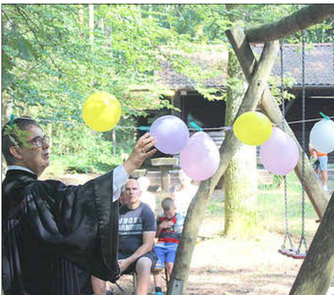
Gottesdienst im Grünen am Grillplatz „Zum Falkenstein“ in Queidersbach - 1. September 2024

Wir danken allen, die diesen besonderen Gottesdienst unter freiem Himmel vorbereitet und mitgestaltet haben.