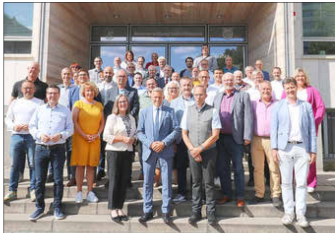
Gruppenbild neuer Kreistag