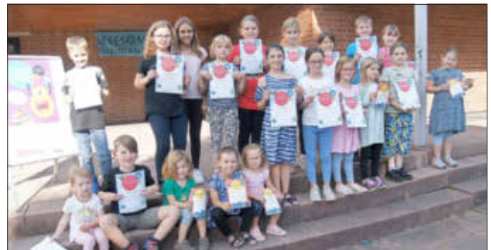
Stolz präsentieren ein Teil der Lese- und Vorlesesommer-Kinder ihre Urkunden

Bei unserem Abschlussfest wurden an alle Teilnehmer, die drei Bücher selbst gelesen oder vorgelesen bekommen hatten, eine Urkunde überreicht. Alle Teilnehmer wurden mit einem kleinen Geschenk belohnt. Das Bücherei-Team bedankt sich bei allen Teilnehmern für vielen Besuche in der Bücherei, die netten Gespräche und die vielen schönen Bilder, die nun die Bücherei verschönern.