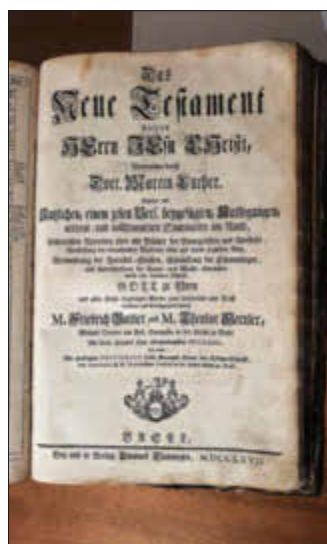
Das Titeldeckblattvor der Restaurierung.