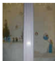
19. Zum Falkenstein Sportheim