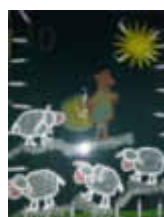
10. Kindergarten Pfarrer-Br. Weg 4