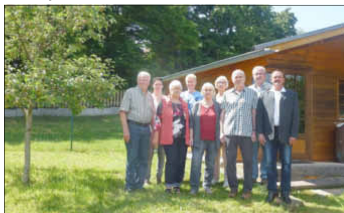
Vorstand seit 23.07.2017 Der Vorstand