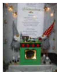
13. Hauptstr. 43a Höhen-Apotheke