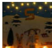
5. Zum Sachsenweg 1