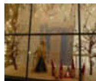
4. Kirchstr. 31