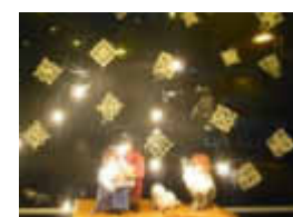
24. Kirchstr. 2 Kath. Pfarrzentrum

Auch in 2018 konnte an jedem Abend ein liebevoll gestaltetes Adventsfenster geöffnet und betrachtet werden. Während der Adventszeit und auch danach, haben viele die Gelegenheit genutzt, sich die wunderbaren Fenster anzusehen.