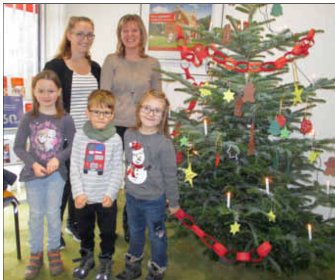
Die Kinder und Erzieherinnen der Kita Arche Kunterbunt