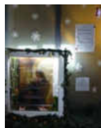
17. Heissen- bergstr. 22