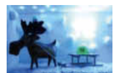
20. Auf der Heide 5 Feuerwehr