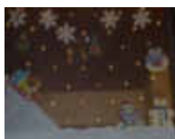
2. Birkenweg 1a