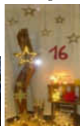
16. Zum Rosental 20