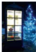
7. Kirchstr. 11 Obst-u. Gartenbauverein