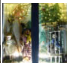
14. Zum Wasserstein 29