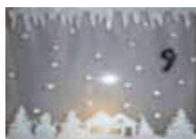
9. Auf der Heide 58