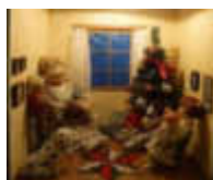
3. DRK Senioren- zentrum