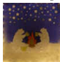
11. Kreuzstr. 15