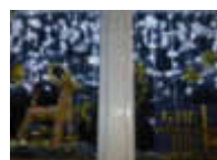
15. Zum Wäldchen 9a