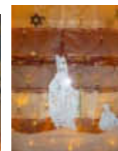
6. Marktstr. 5a