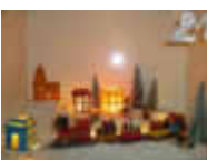
21. Kirchstr. 4