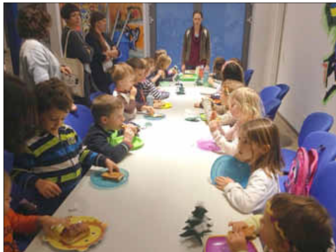
Wer findet die Figur im Dreikönigskuchen?

Die Legende erzählt, wie die Tanne einem verletzten Vogel im kalten Winter Hilfe und Schutz gewährt und als Dank immer grün bleibt. Dazu hielten die Kinder ganz fix die bunt bemalten Symbolkarten bei den jeweiligen deutschen und französischen Stichwörtern: „Tanne, Baum,