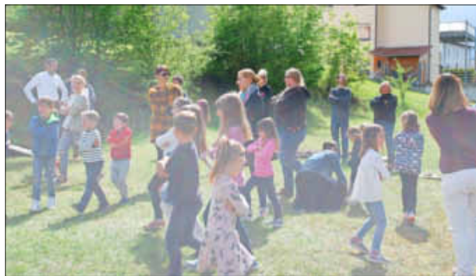
Beim „Maxe“ machen alle mit

Die Lese-Lok fährt mit Leslie und den Bücherwaggons im Juni wieder zum Landesbibliothekszentrum Neustadt zurück, doch im nächsten Jahr macht sie hoffentlich wieder in Stelzenberg Station.