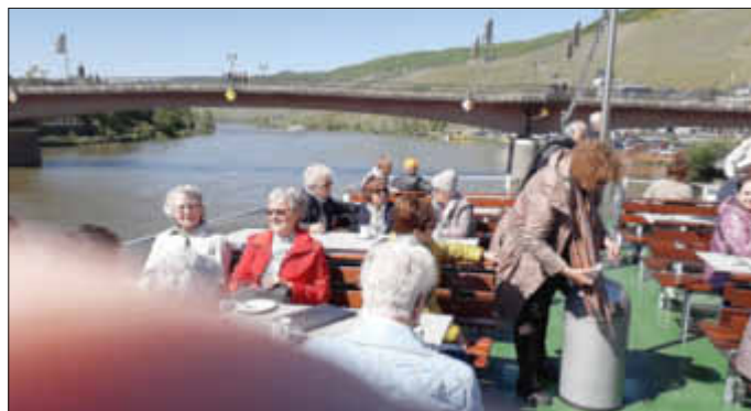
...und auf der „Moselkönigin“