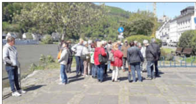
Gute Stimmung in der Stadt...

Am 15. Mai 2019 unternahm der OV mit 50 Teilnehmern eine Tagesverfahrt an die Mosel. Bei herrlichem Sonnenschein ging die Fahrt mit dem Bus über die Hunsrückhöhenstraße nach Traben-Trarbach. Vorort gab es eine Führung mit ausführlichen Erklärungen der Stadtführerin durch die Unterwelt der Stadt, die früheren Weinkeller. Anschließend führen sie nach Lösnich zum Mittagessen. Danach ging es weiter nach Bernkastel-Kues zu einer 1-stündigen Schifffahrt auf der Mosel. Anschließend war noch Zeit für einen gemütlichen Stadtbummel durch die malerische Altstadt mit den jahrhundertealten Fachwerkhäusern bzw. Einkehr in eins der vielen schönen Gasthäusern. Am frühen Abend waren alle Teilnehmer wieder wohlbehalten mit tollen Eindrücken zu Hause.