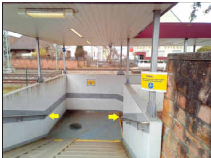
(Das Bild zeigt die restlichen Treppenhandläufe der Bahnunterführung Kindsbach)

Diebe entwendeten Mitte März die Treppenhandläufe der Auf- und Abgänge in der nördlichen Bahnunterführung der Ortsgemeinde Kindsbach. In der Zeit 22.03.2019 - 24.03.2019 stahlen die Diebe auch die Treppenhandläufe im südlichen Teil der Bahnunterführung. Vertrauliche Hinweise zur Tat können Sie an unser Bauamt, Fr. Agne 06371/83146 richten.