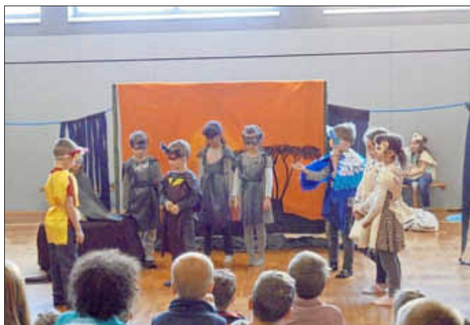
(Text und Fotos: Grundschule „In der Au“)