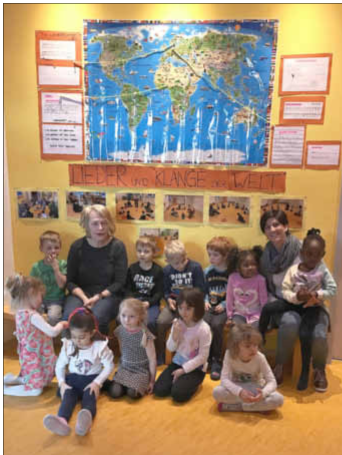
(Text und Foto: Kita Wichtelburg)

Eine schöne Woche, reich gefüllt mit viel neu Gelerntem ging zu Ende.