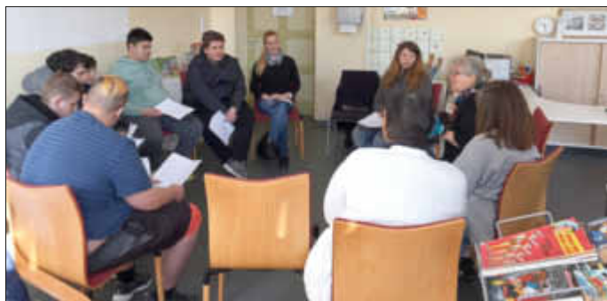
(Text und Foto: Jakob-Weber-Schule)