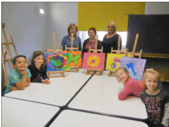
(Text und Foto: Kita Pickolino)