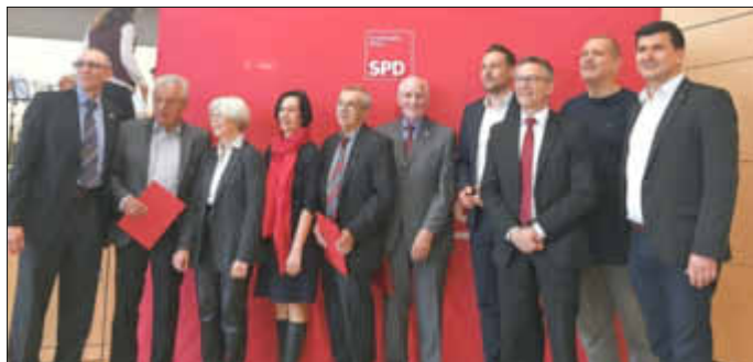
( Die Ehrengäste und Jubilare)