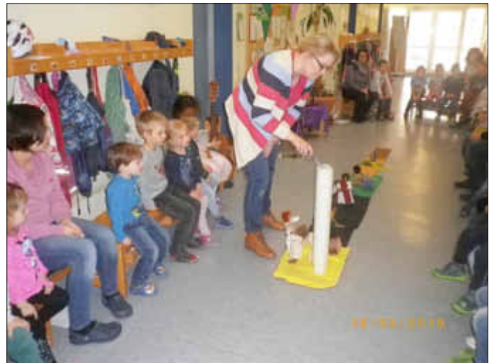
(Text und Foto: KiTa)

„Ein Stift, ein paar Farben und Papier...“ Dieses Lied von H. Adam war während der Fastenzeit in der katholischen Kindertagesstätte St. Elisabeth Kindsbach oft zu hören. Wie in jedem Jahr begannen die Kinder und die Erzieherinnen diese besondere Zeit mit einem religiösen Projekt. Sie griffen die Idee von „Max Pinsel“ auf, die auf der Aktionsseite für Kitas des Bistums Speyer ausgearbeitet ist und ergänzten die Geschichten des Malers, der sich mit Jesusgeschichten gut auskennt und diese den Kindern erzählte, mit weiteren Erzählungen aus der Bibel. Höhepunkt war am Donnerstag vor Ostern die gemeinsame Auferstehungsfeier, bei der es Gemeindeferentin Frau Meyer-Kuhn gelang den Kindern ihr vorhandenes Wissen über Palmsonntag, Gründonnerstag und Karfreitag zu entlocken und das wichtigste Fest der Christen, Ostern, in anschaulicher Weise deutlich zu machen. Das Gestalten mit Tüchern, biblischen Erzählfiguren, Blumen, Osterkerze und das gemeinsame Singen der vorbereiteten Lieder lies die Vorfreude auf Ostern bei allen Beteiligten wachsen. Genauso wie Max Pinsel durften die Kinder ihre Freude beim Malen eines Bildes zur Auferstehung ausdrücken.