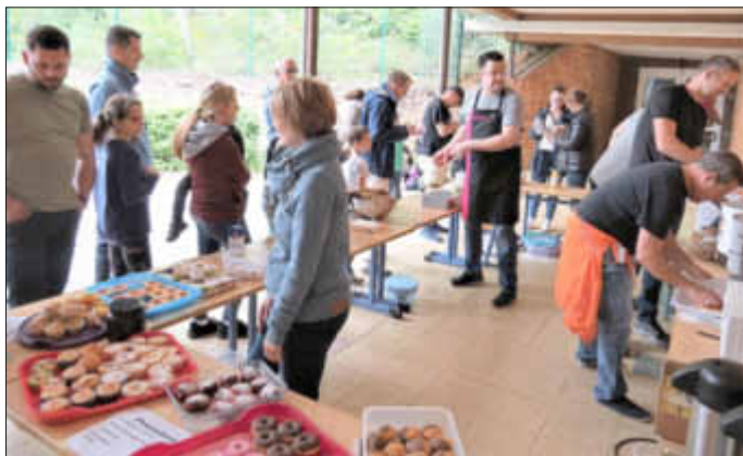
(Text: Wi-Bo)