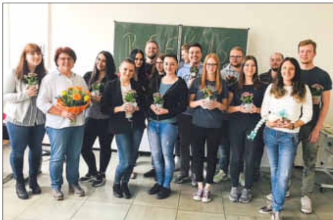
(Text und Foto: BBS Landstuhl)

Wir wünschen den Absolventinnen und Absolventen für ihren weiteren Lebensweg viel Erfolg und alles Gute und danken den Lehrerinnen und Lehrern sowie allen dualen Ausbildungspartnern.