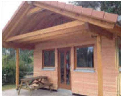
Florianhütte hinter der Feuerwache

Besonders in Erinnerung geblieben ist der gemeinschaftliche Bau der Florianshütte auf dem Gelände der Feuerwehr. Der Bau wurde erst durch die unzähligen Stunden ehrenamtlicher Eigeninitiative der Feuerwehrangehörigen ermöglicht.