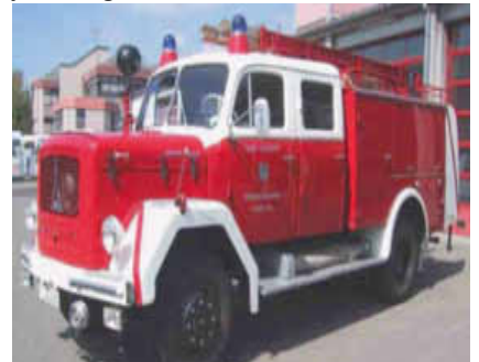
Restauriertes Tanklöschfahrzeug „Ellisje“

Ein weiteres kameradschaftliches Projekt zeigt die Restauration des Tank-