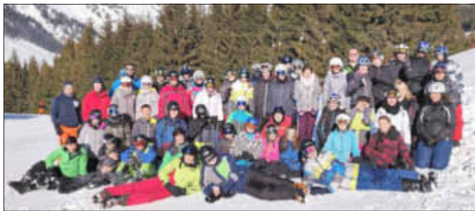
(Text und Foto: Sickingen Gymnasium)

Ab Mitte der Woche löste strahlender Sonnenschein das Schneegestöber ab, was der Gruppe einen gigantischen Lernfortschritt ermöglichte. Die klare Sicht eröffnete vielen erst Mitte der Woche von welch riesigen Bergen sie bereits geschmeidig auf ihren Skiern hinabfuhren. Das gigantische Ausmaß der Berge sowie die persönlichen Lernfortschritte trugen zur absoluten Zufriedenheit der Gruppe bei. Voller Erwartungen wurde somit dem Skirennen am Freitagnachmittag entgegengefebert, wobei am Ende jeder der technisch saubersten Skifahrerinnen den Sieg trotz Handicap gönnte. Ein letztes Mal genoss die Gruppe das Wintermärchen bei einer abendlichen Fackelwanderung. Mit einer umfangreichen Diashow über die gemeinsamen Erlebnisse und einer ereignisreichen After-Show-Party wurde nicht nur die diesjährige Skifahrt, sondern auch eine zwanzigjährige Ära des Sickingen-Gymnasiums mit einem Feuerwerk der Winteremotionalen abgeschlossen. Für 2020 muss eine neue Unterkunft gesucht werden, da die Herbergseltern dem Pensionsalter entgegenblicken und das Jugendhaus zu Appartementswohnungen umgebaut wird. Hier sind wir bereits mitten in den Vorbereitungen für die Skifahrt der aktuell drei siebten Klassen und freuen uns bereits auf ein neues modernes Reiseziel mit einem ebenso großen Reichtum an Wintererlebnissen.