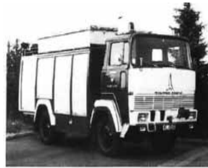
Rüstwagen RW2 Öl

Feuerwehr verkauft und durch ein leistungsfähigeres Modell mit stärkerer Pumpe sowie einem 400 Liter Wassertank ersetzt. Bei einem Löscheinsatz am Bahnhof 1944 wurde dieses jedoch bombardiert und zerstört. Erst eine Dekade später konnte ein neues Tanklöschfahrzeug, mit einem 2200 Liter fassenden Wassertank, beschafft werden. Um dennoch die Einsatzfähigkeit zu gewährleisten, wurde zwischenzeitlich ein Fahrzeug aus Otterberg ausgeliehen. Anfang