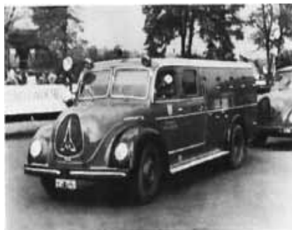
Tanklöschfahrzeug TLF 15

In den ersten Jahrzehnten verfügte die Feuerwehr Landstuhl nur über eine geringe Anzahl an Gerätewagen, Leitern und handbetriebene Pumpen, welche von den Feuerwehrmännern per Hand zur Brandstelle gezogen werden mussten. Erste Erleichterung verschaffte die 1927 angeschaffte Benzinmotorspritze sowie das 1942 in Dienst gestellte erste motorbetriebene Löschgruppenfahrzeug. Dieses wurde allerdings schon im darauffolgenden Jahr an die Ramsteiner