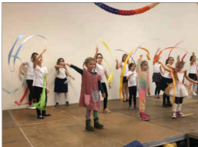
Fire Girls Mittelbrunn

Am Sonntag, den 23.02.20, eröffnete der Förderverein Kindergarten Mittelbrunn e. V. den zweiten mittelbrunner Kinderfasching mit einem fröhlichen „Mittlau!“.