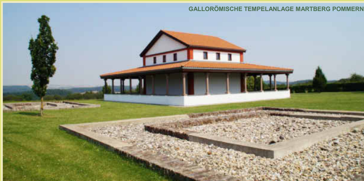
GALLORÖMISCHE TEMPELANLAGE MARTBERG POMMERN