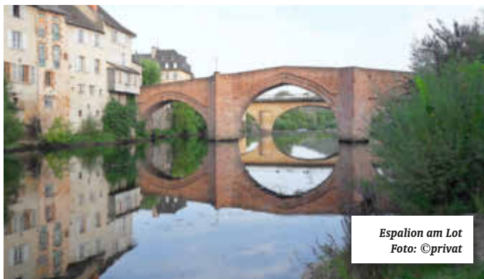
Espalion am Lot