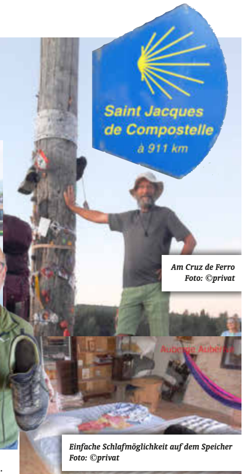
Am Cruz de Ferro