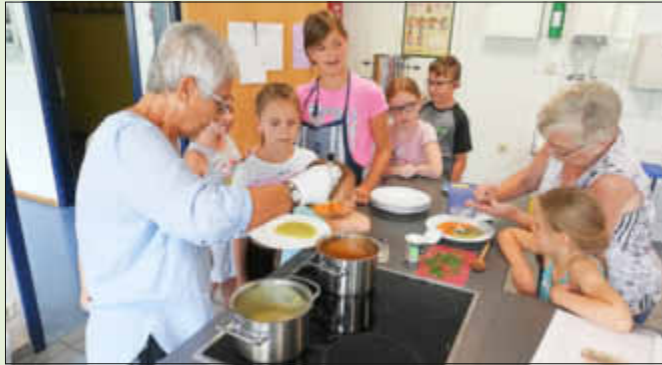
(Text & Fotos: Fee Weismann)