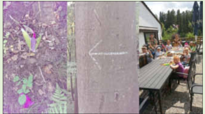
(Text: Martina Voiciuc)