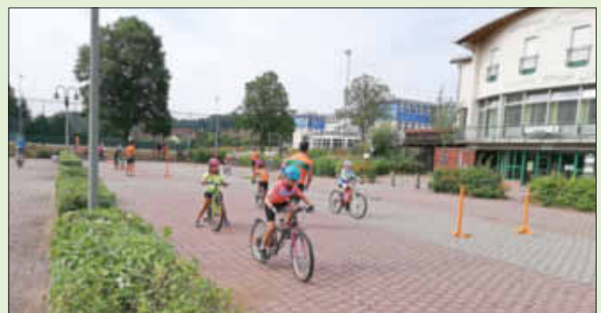
(Text & Fotos: Fee Weismann)