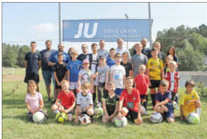
Teilnehmer des 6. Fußballcamps der Jungen Union Landstuhl