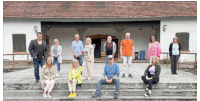
Vorstandschaft der Creativ-Bühne Trippstadt e.V.