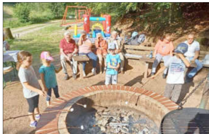
Die Jüngsten am Ende der Veranstaltung beim Grillen ihrer Marshmallows.