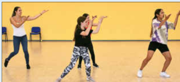
(Tanzsportclub Landstuhl - Afrodance, Hip-hop)