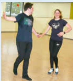
Tanzsportclub Landstuhl - Lateintanz)