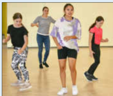
(Tanzsportclub Landstuhl - Dancehall)