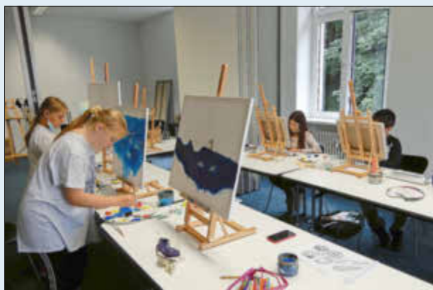
(Artothek - Acrylmalerei „Ich will Meer sehen“)