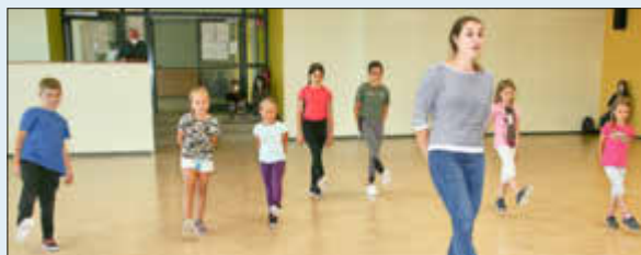
(Tanzsportclub Landstuhl - Discotanz)