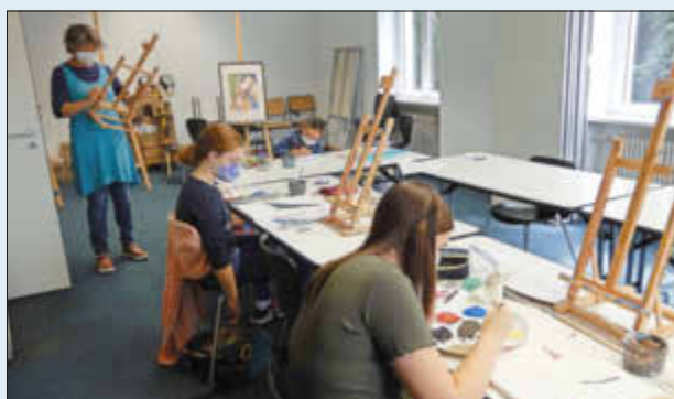
(Artothek - Acrylmalerei „Ich will Meer sehen“)