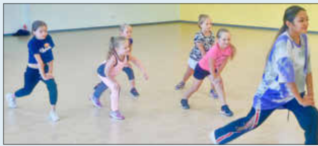
(Tanzsportclub Landstuhl - Breaking)