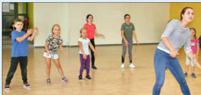
(Tanzsportclub Landstuhl - Kindertanzen)