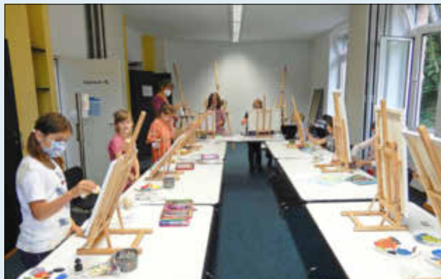
(Artothek - Acrylmalerei „Sommer- und Sonnenfarben“)