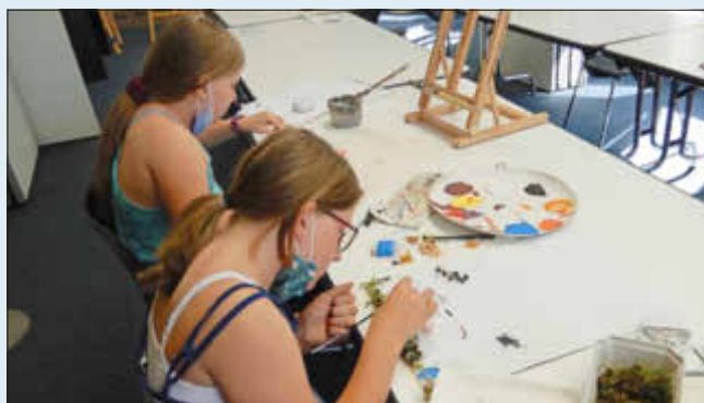
(Artothek - Acrylmalerei „Wesen aus einer anderen Welt“)