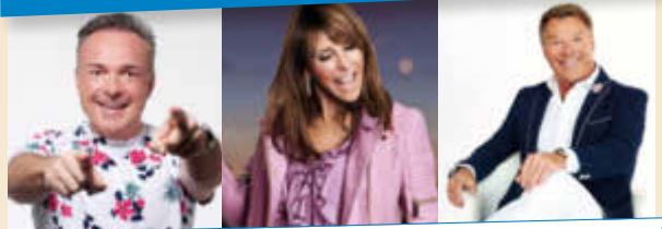
Tim Toupet, Ireen Sheer und Patrick Lindner