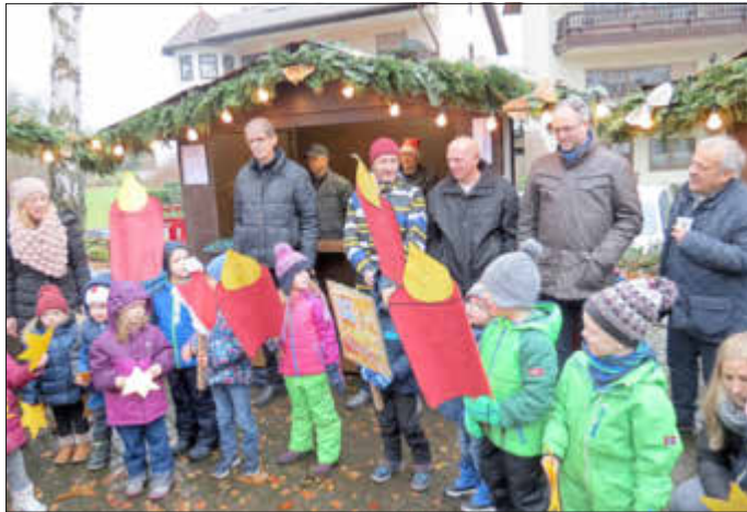
(bor. Foto/Text: Team Melkerei)

Der von neun Verkaufs- und Essensbuden umrahmte Markt mit einem zentralen Feuer auf der Platzmitte gab dem Fest eine familiäre Atmosphäre, die am Abend durch die Weihnachtsbeleuchtung des Platzes noch unterstrichen wurde. Ein Duft von Waffeln und Glühwein, appetitlichem Essen und einem schönen Angebot an Schmuck, Holzartikeln zur Weihnachtszeit oder Strickwaren ließen das nasse und windige Wetter zumindest etwas in Vergessenheit geraten.