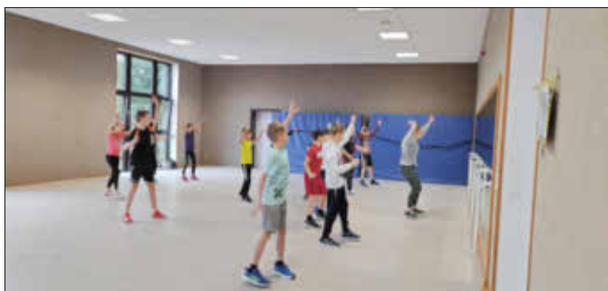
Schülerinnen und Schüler des Sportförderkurses beim Sportangebot des TSC Landstuhl (Tanzen; zum Zeitpunkt der Aufnahme herrschte noch keine Maskenpflicht im Sportunterricht)