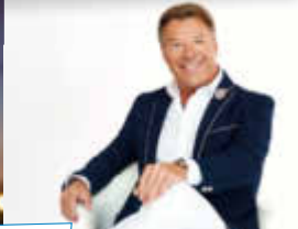
Tim Toupet, Ireen Sheer und Patrick Lindner