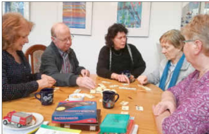
Unser Foto zeigt einen Teil der spielenden Gesellschaft.

Zu einem „Hüttenabend der besonderen Art“ lud die Freie Wählergruppe Stelzenberg e. V. die Bewohner der Gemeinde Anfang Februar ins örtliche Bürgerhaus ein.