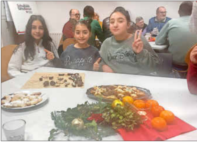
Die Ehrenamtlichen der Malteser Kaiserslautern feiern gemeinsam mit geflüchteten Familien und Teilnehmern des Seniorenkreises