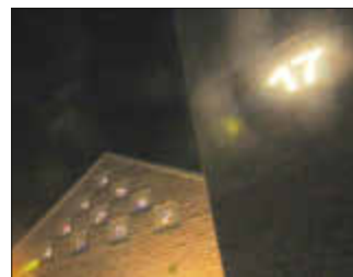
Adventsfenster am 17. Dezember 2022 an der Protestantischen Kirche Schopp

Im alten Jahr luden wir zum 17. Adventsfenster auf dem Kirchenvorplatz in Schopp ein. Bei klirrender Kälte hatten sich viele Bürger*innen eingefunden und verbrachten bei weihnachtlichen Liedern, Wärmendem für Leib und Seele einen sehr gemütlichen Abend. Vielen Dank allen, die beim Schopper Adventsfenster mitgeholfen haben!