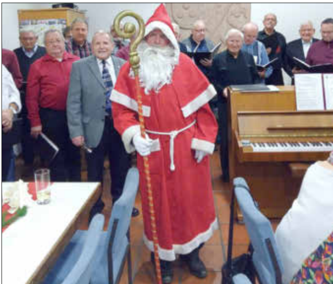
St. Nikolaus mit den Sängern bei der Weihnachtsfeier des MGV