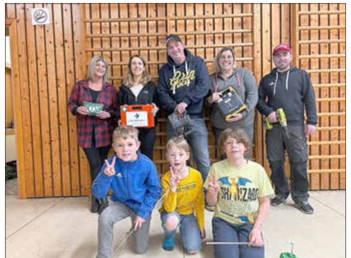
Die fleißigen Helfer

Vielen Dank an die fleißigen Helfer, die bei der Montage mitgeholfen haben.