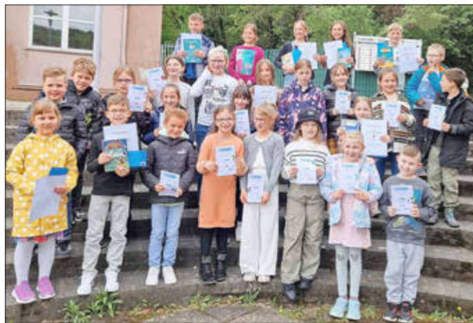
Alle teilnehmenden Kinder.