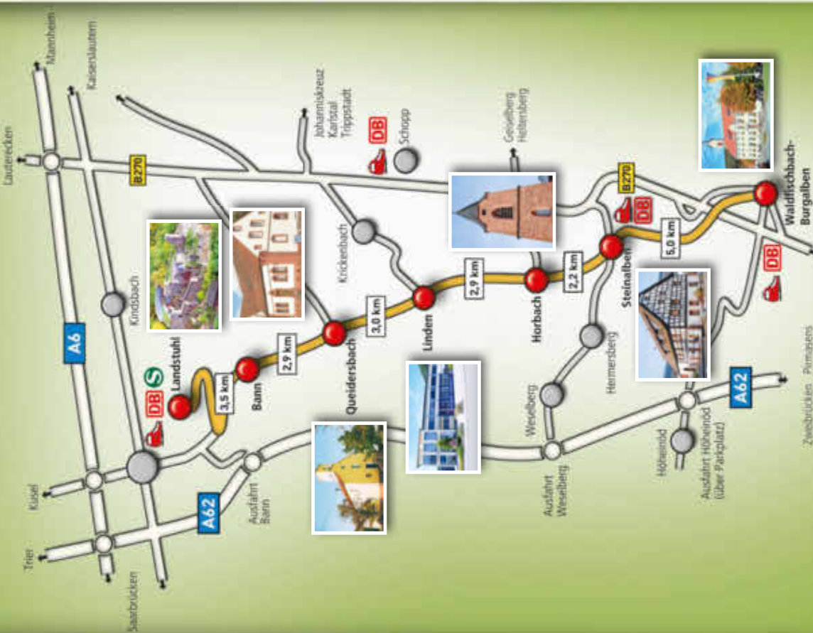
Verschiedene Erste-Hilfe-Stationen des Deutschen Roten Kreuz entlang der gesamten Strecke.