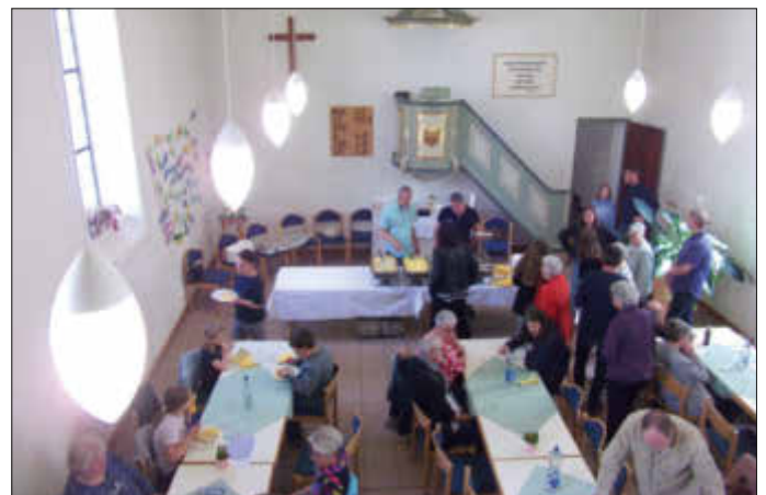
Mittagessen an Christi Himmelfahrt in der Protestantischen Kirche Linden