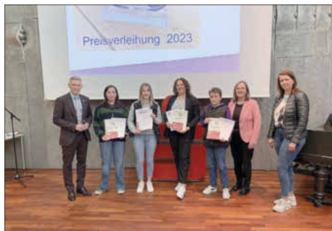
IGS am Nanstein