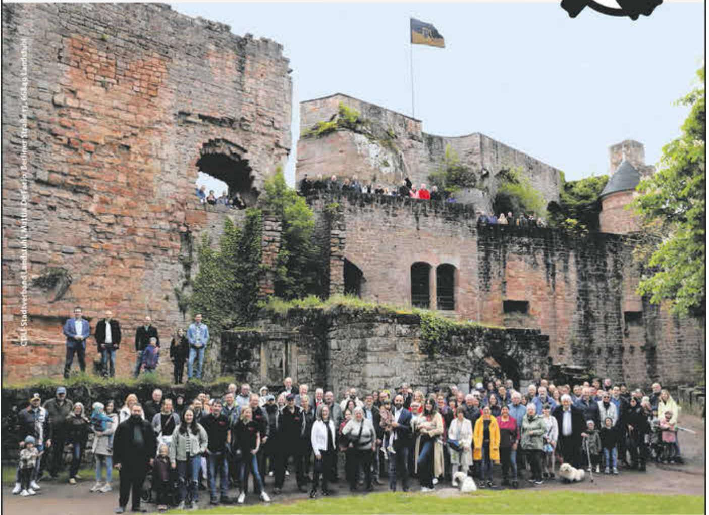
CDU - Stadtverband Landstuhl, Wittold-Deffarpf, Berliner Kirchweg, 65434 Landstuhl