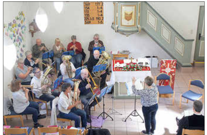
Der Posaunenchor Trippstadt im Gottesdienst an Pfingstmontag in der Protestantischen Kirche Linden