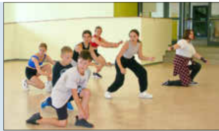
Tanz und Spiel für Kinder von 5 bis 10 Jahren