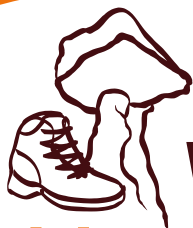
Anablick Geiersteine-Tour

Tourist-Info-Zentrum Pfälzerwald Schuhmeile 1 · 76846 Hauenstein · Tel. 06392 9233380 www.urlaubsregion-hauenstein.de