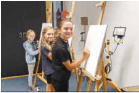
Offene Werkstatt „Einfach drucken – Kartoffeldruck“ 21.08.2023