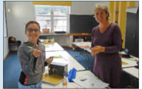
Offene Werkstatt „Einfach Drucktechniken – Bilder aus CDs“ 23.08.2023