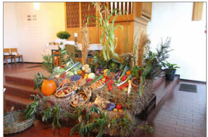
Erntedankschmuck des Obst- und Gartenbauvereins in der Protestantischen Kirche Schopp