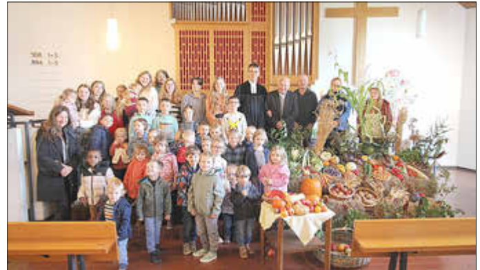
Erntedankfest in der Protestantischen Kirche Schopp am 29.09.24

Am 29. September '24 feierten wir zusammen mit der Protestantischen Kindertagesstätte Arche Kunterbunt in unserer Kirche einen Familiengottesdienst, der sehr gut besucht war. In einem Klangspiel erzählten und musizierten die Kinder eine Geschichte vom Korn zum Mehl und schließlich zum täglichen Brot. Wie jedes Jahr durften wir uns auch diesmal wieder am wunderschönen Erntedankschmuck des Obst- und Gartenbauvereins Schopp erfreuen. Allen, die unser Erntedankfest vorbereitet und mitgestaltet haben, sei an dieser Stelle herzlich gedankt!