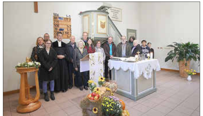
Erntedankfest in der Protestantischen Kirche Linden am 29.09.24