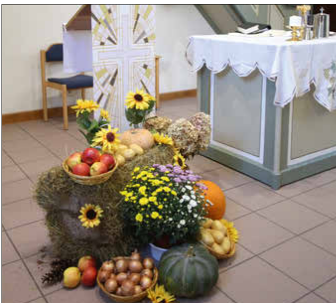
Erntedankschmuck in der Protestantischen Kirche Linden